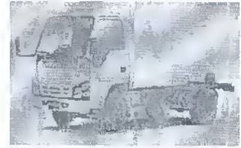
- کامیونت ۸ تن ایسوزو (NPR۵M)