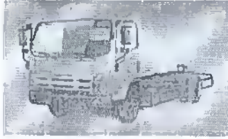
- کامیونت شیلر ۶