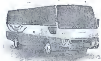
- مینی بوس شیلر