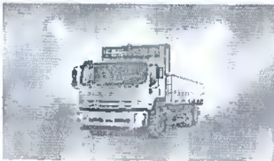
- کامیون ۲۶ تن (FVZ)