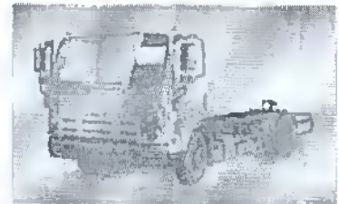
- کامیون ۱۸ تن ایسوزو (FVR)