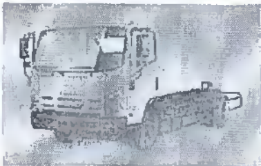
- کامیون ۲۶ تن (FVZ)